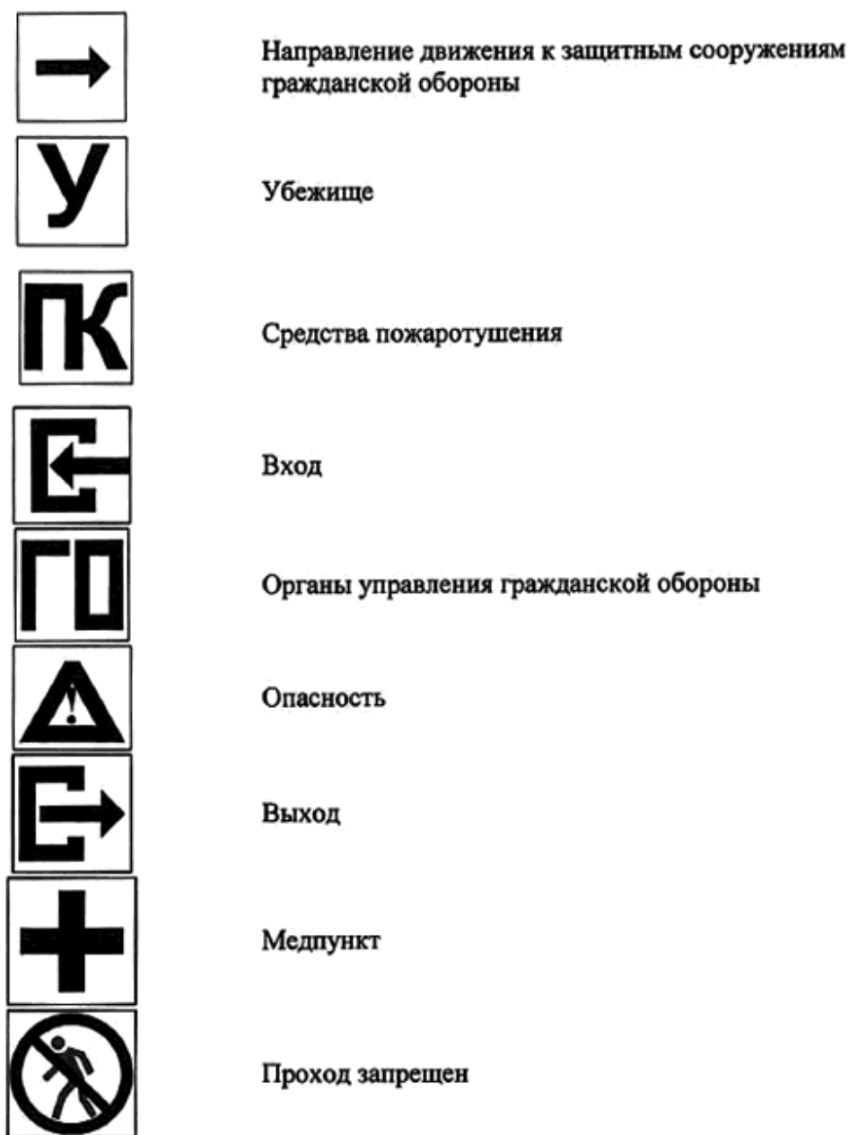
Рисунок Л.1 - Световые знаки, работающие в режимах частичного затемнения и ложного освещения